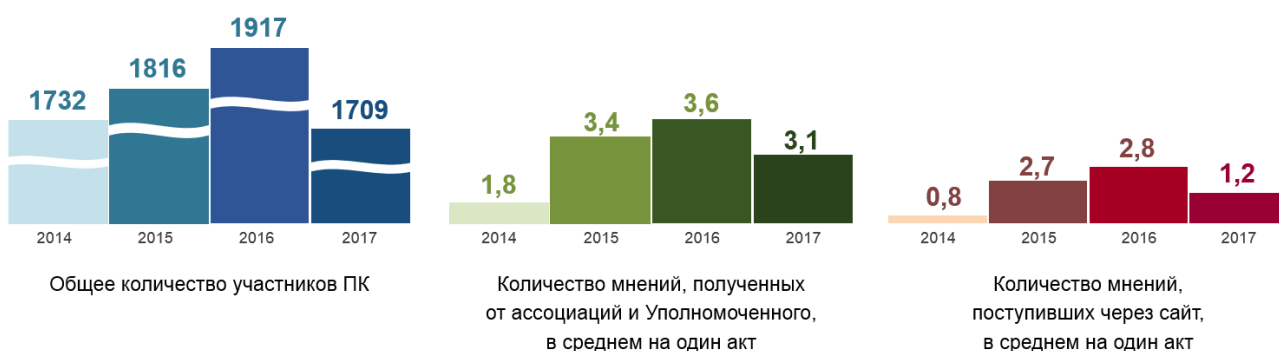
Рисунок 2. Динамика количества участников публичных консультаций в 2014-2017 гг.

За 2017 год активность участия в ПК субъектов предпринимательской и инвестиционной деятельности, представителей предпринимательских объединений и общественных организаций осталась практически на прежнем уровне. Среднее количество субъектов предпринимательства, участвовавших в обсуждении одного акта (проекта акта), составило 70. Некоторое сокращение количества участников по сравнению с предыдущим годом объясняется спецификой актов и их проектов, вошедших в перечень